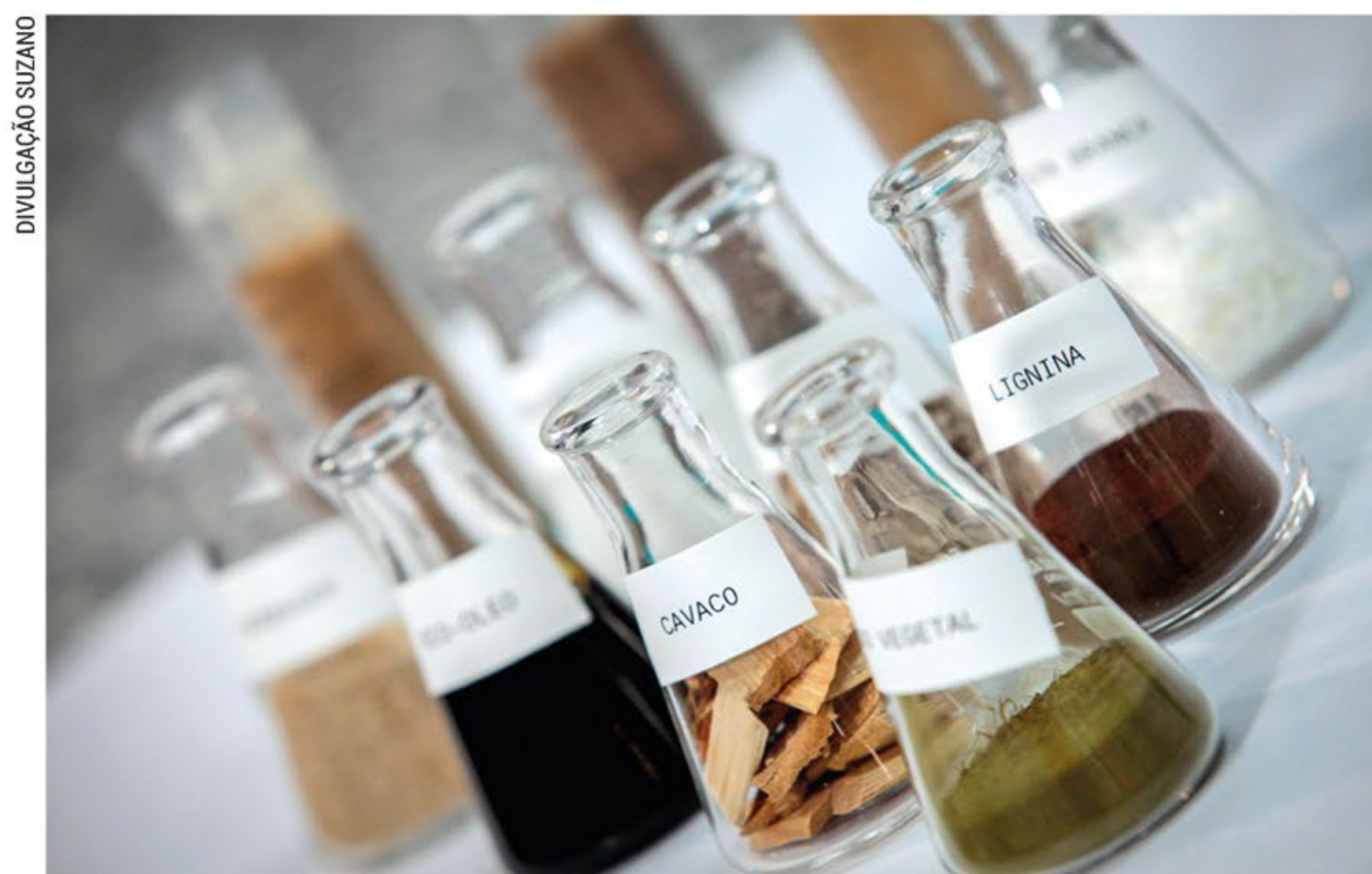
A indústria de árvores cultivadas pode produzir uma ampla gama de produtos de base biológica, substituindo materiais e produtos derivados de fontes não renováveis

O BNDES Mais Inovação contempla mais alguns exemplos de inovações apoiáveis no setor de base florestal: desenvolvimento de clones de eucalipto de melhor desempenho e adaptados às características brasileiras; introdução do conceito de biorrefinarias para melhor aproveitamento da biomassa de florestas plantadas; ampliação da contribuição de florestas plantadas para recuperação de áreas e captura de CO 2 ; novos usos para materiais e produtos, como aplicações de lignina e usos de carvão vegetal, e oportunidade de aproveitamento mais eficiente de resíduos, como produção de fertilizantes a partir de elementos anteriormente sem uso. “Todas estas possibilidades de financiamento a esta cadeia representam a importância que o BNDES