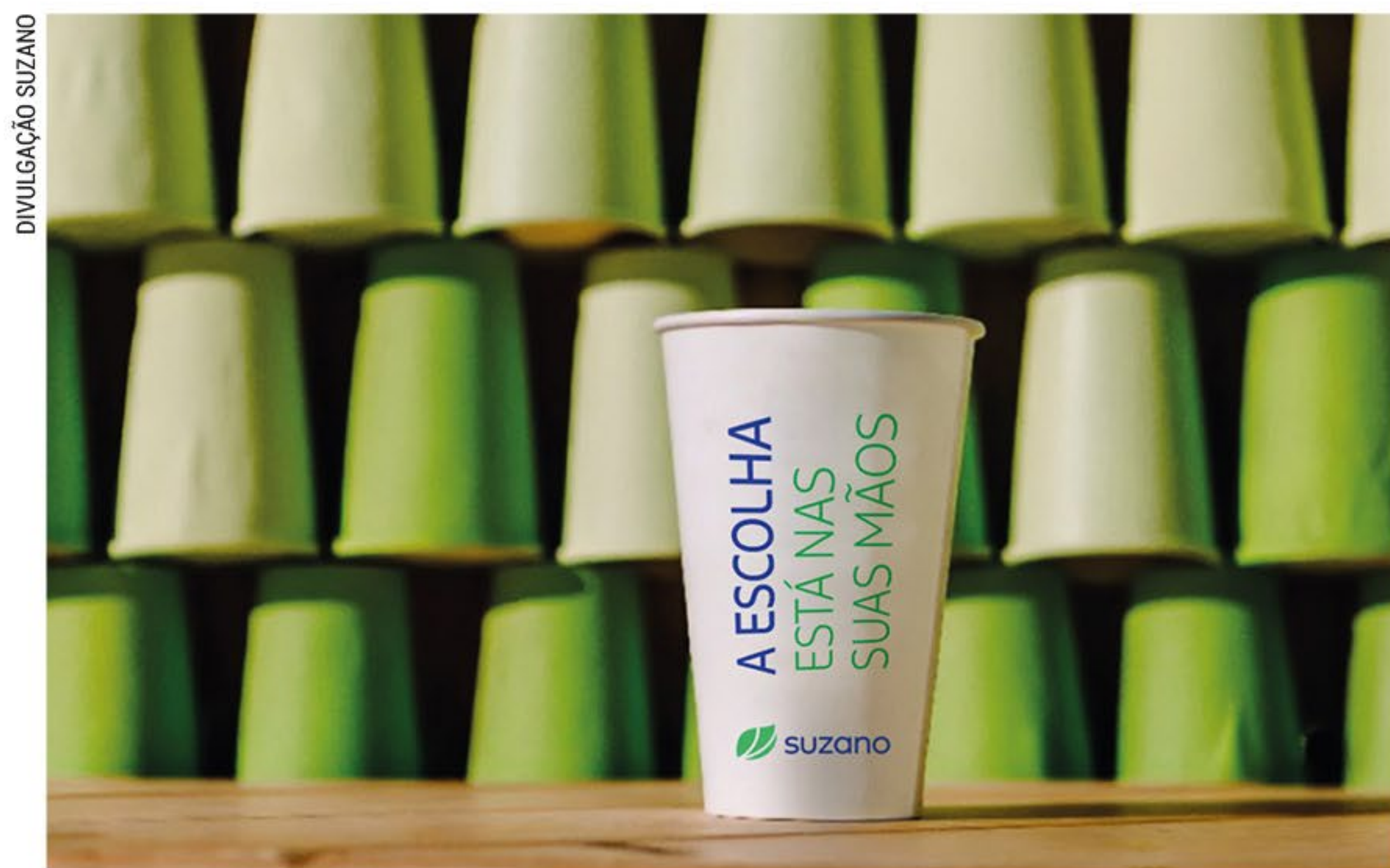
No funil da inovação, os fabricantes estão desenvolvendo projetos 100% de fonte renovável para atender à necessidade dos consumidores: papéis, barreiras e demais insumos