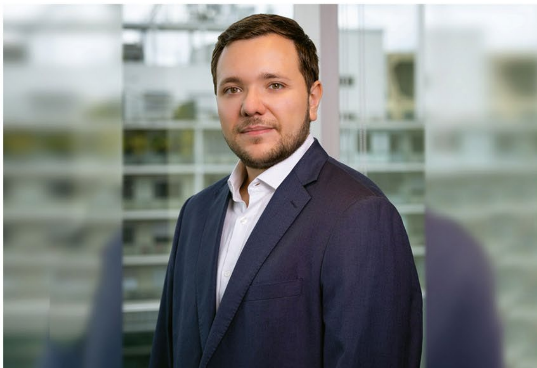
"Acreditamos que a maior parte dos ajustes econômicos causados por um orçamento mais curto nas famílias ficou em 2023 e isso levará a melhores condições para o consumo das famílias em 2024", sinaliza Barisauskas

das famílias em 2024. Vários programas de renegociação de dívidas foram lançados no último ano e devem aliviar o orçamento já ao longo deste ano", aponta o economista da América Latina da Fastmarkets RISI.