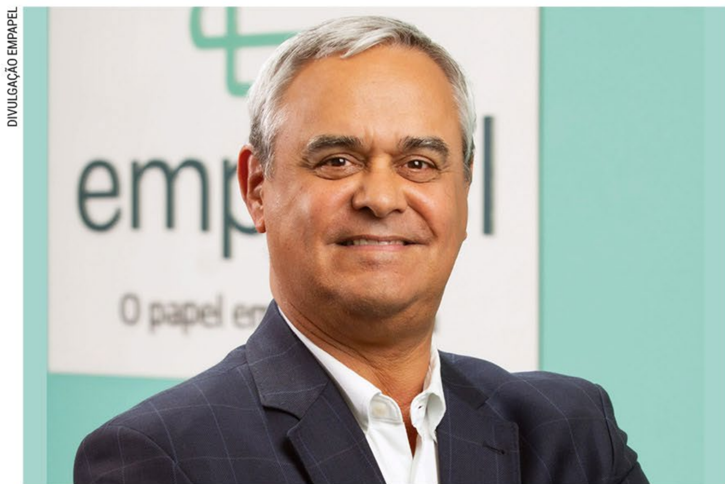
“As previsões realizadas durante o ano de 2023 foram constantemente revisadas para cima, felizmente, com melhora no consumo, queda dos preços e início de queda dos juros. Os serviços se mantiveram resilientes, embora o comércio tenha uma performance mais fraca e a indústria em fase de baixa”, detalha Fonseca Jr.

Para 2024, o cenário mostra-se ligeiramente mais positivo. “Acreditamos que a maior parte dos ajustes econômicos causados por um orçamento mais curto nas famílias ficou em 2023 e isso levará a melhores condições para o consumo