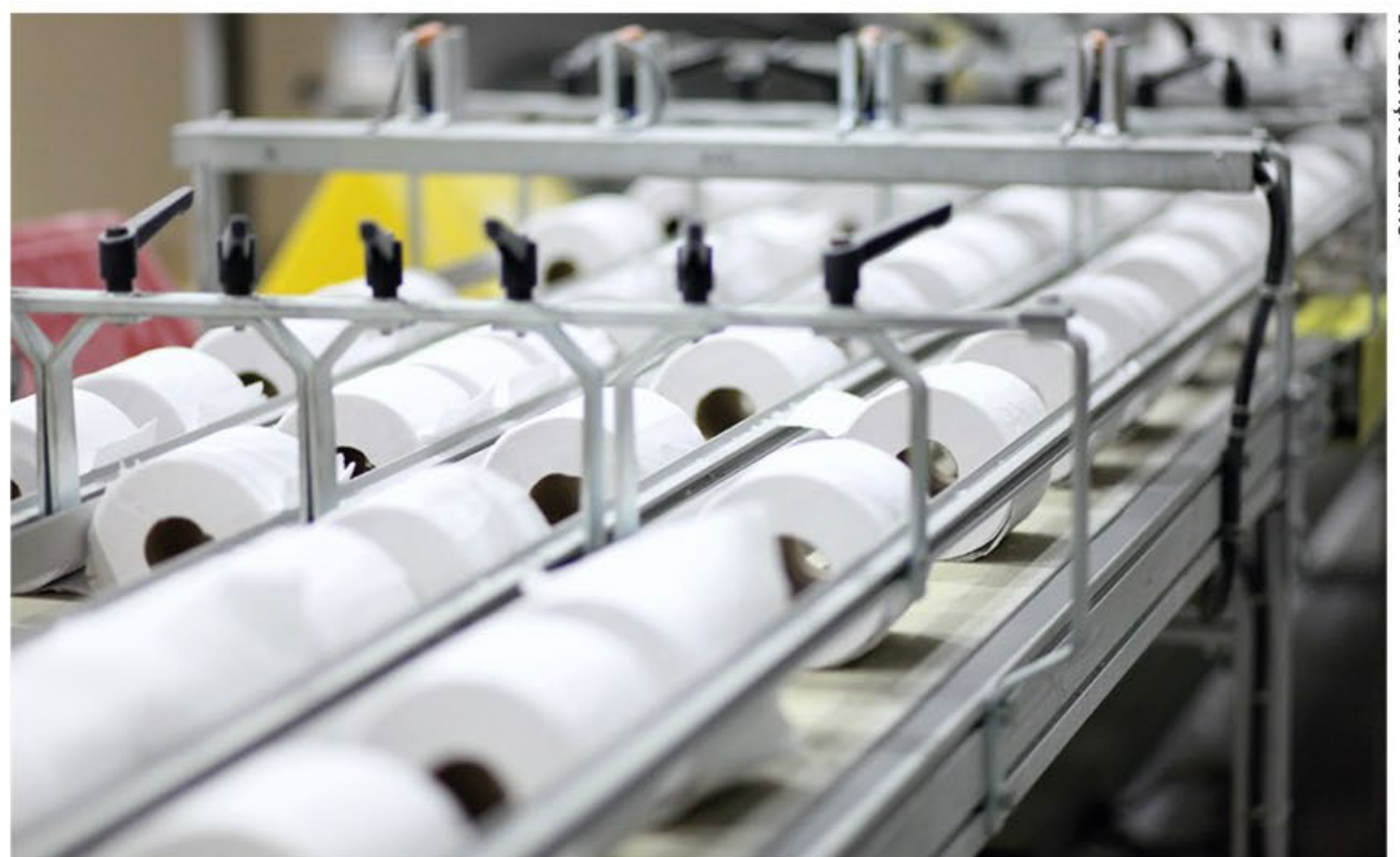
O segmento tissue vem demonstrando desempenho satisfatório no Brasil em razão da mudança de hábito de consumo do brasileiro

Também avaliando o desempenho do mercado de imprimir e escrever, Collares informa que a substituição por meios eletrônicos continua a fragilizar os resultados. “Infelizmente, alguns países, como Brasil e Índia, terão seu consumo reduzido sem antes terem atingido o consumo per capita de países desenvolvidos, tal e qual ocorreu com o papel jornal. Dessa forma, o consumo residual tende a ser menor nos próximos anos.” Contudo, o vice-presidente de Desenvolvimento de Negócios da Cadeia de Valor Florestal da ResourceWise pondera que os players do segmento puderam se beneficiar das exportações, conferindo bons resultados mesmo com a queda da demanda interna. ■