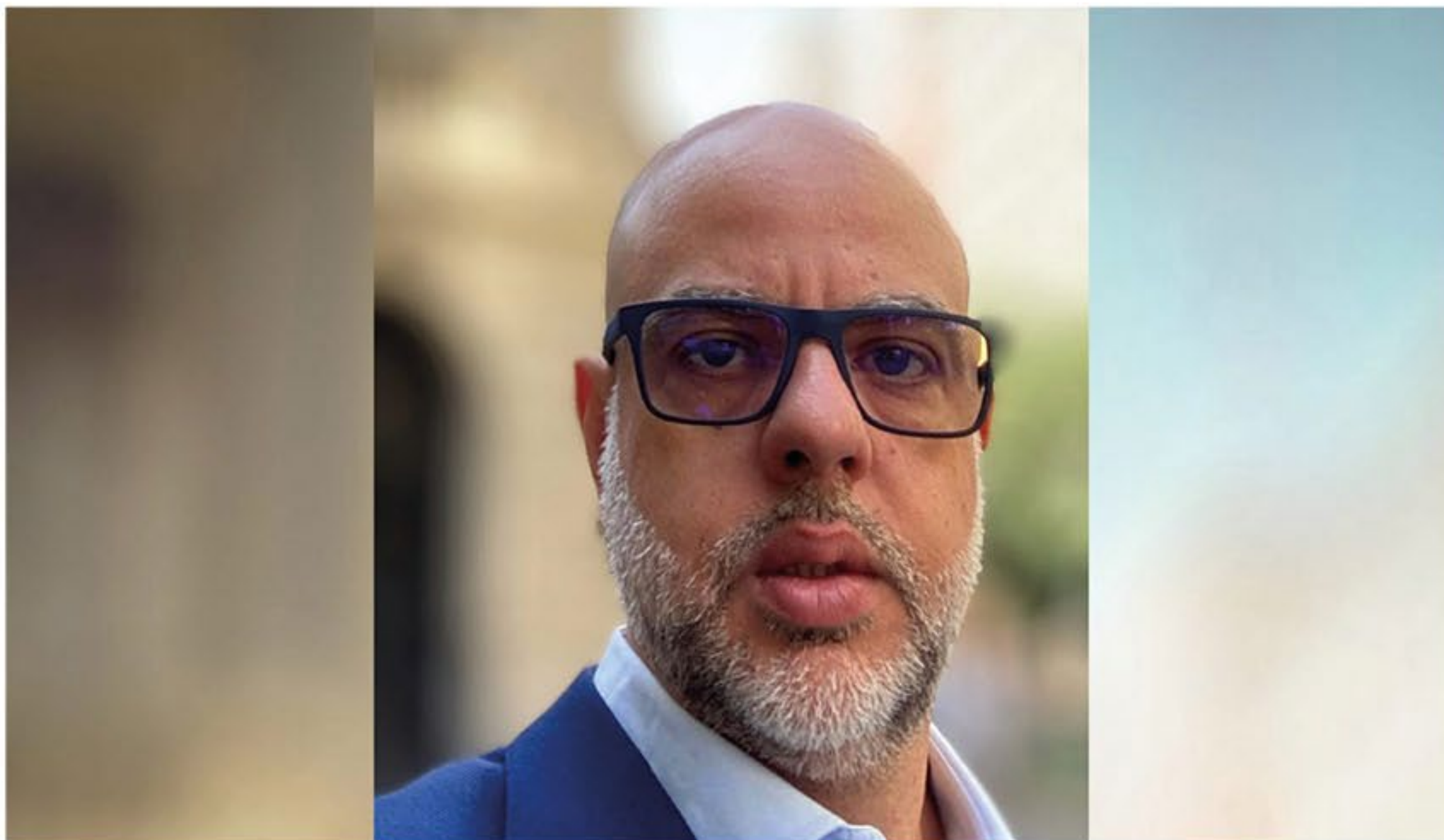
Collares pondera que os players do segmento de imprimir e escrever puderam se beneficiar das exportações, conferindo bons resultados mesmo com a queda da demanda interna

de Emissores da B3. “Cabe pontuar que os desdobramentos regulatórios também serão fundamentais para garantir a solidez e efetividade da agenda no Brasil, o que vai desde a adaptação da ICVM 175 para fundos de investimento, com a inclusão de aspectos de sustentabilidade, ou da ICVM 193, que reafirma o compromisso do mercado brasileiro com transparência de informações de sustentabilidade e climáticas, com a incorporação do International Sustainability Standards Board (ISSB).